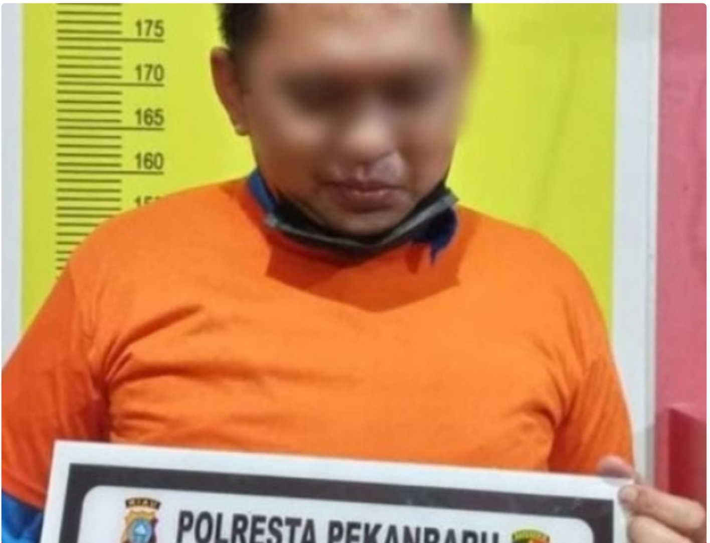
LY Akhirnya Resmi Menjadi Tersangka

Pekanbaru, -Penyidik Satuan Reserse Kriminal (Satreskrim) Polresta Pekanbaru menetapkan oknum aktivis berinisial LY sebagai tersangka, Senin (14/3/2022) malam.